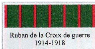
Ruban de la Croix de guerre 1914-1918

La Croix de Guerre la plus « chargée » est celle de l'As des As français René Fonck(1894-1953) avec 28 palmes et 1 étoile. 75 victoires en combats aériens.