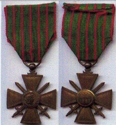
Médaille et ruban