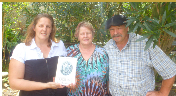
Le premier livre de recueil de cartes postales et photos sur Ossun