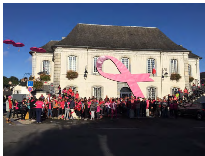
Les participants à la marche de 9 km

Une première réussie et le début de plusieurs OSSUN EN ROSE.