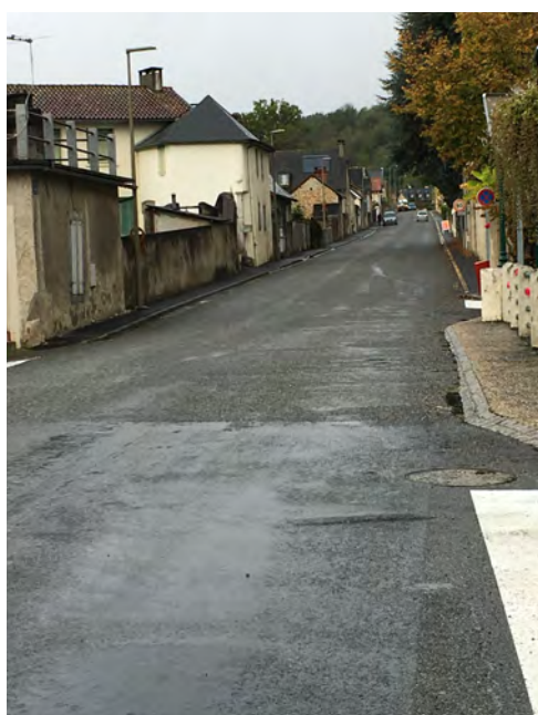
Route de Pontacq

Le revêtement de la route de Pontacq a été rénové par le Conseil Départemental et les trottoirs ainsi que les murs de soutènement par la commune.