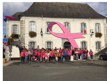
Les participants à la marche de 4 km