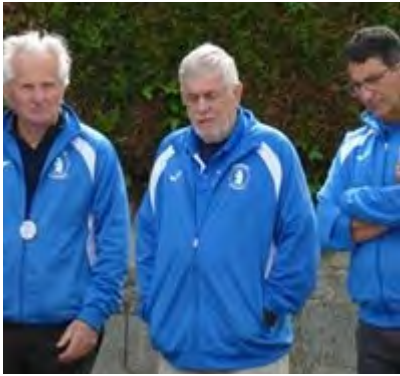
Une équipe en réflexion

Le dimanche 12 octobre s'est déroulé la 4 ème et 5 ème journée du championnat open des clubs du 65.