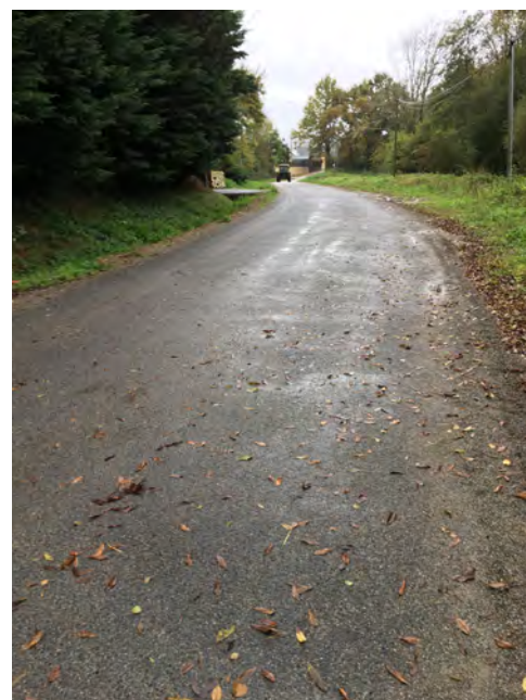
Chemin du bois

Le chemin du bois a été rehaussé sur quelques mètres car il était souvent inondé lors des gros orages, empêchant la circulation et l'entrée des riverains.