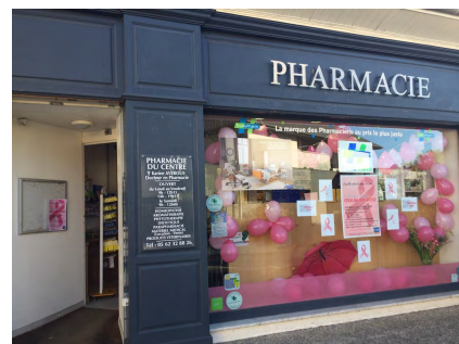
Deux vitrines de commerçants parmi tant d'autres