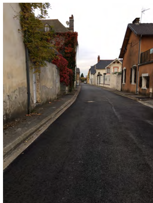
Route de Lourdes